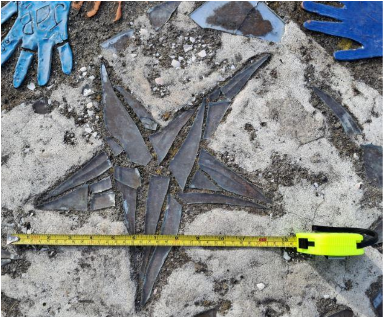
Fig. #G2a (from this web page "rok_uk.htm"): http://pajak.org.nz/nz/pentagram_petone.jpg

#353E and in #H4 to #H4b from my web page called "will.htm" that the Bible quite clearly warns us to prevent this on time, that it is this global monopoly of the Internet that can turn into that Biblical beast 666 that will be able to destroy anyone who tries to resist it, because it has the power to immediately cut off access to electronic funds and close all accounts that it wants, so that a given person or institution will NOT be able to sell or buy anything. If one looks around, the Internet is already rapidly taking monopolistic control over every aspect of our lives. But instead of remembering the Bible's warning and seeing the danger it brings us, most people are happy about it because they can jiggle to Internet music and watch effortlessly as various athletes destroy their bodies and cheat in order to rise above others and gain a moment of fame and short-term access to money and admirers.